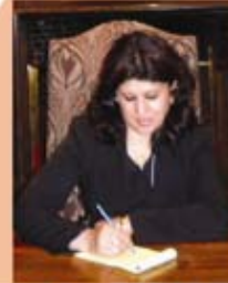
تافگه‌ عمر رشید

له به‌شی به‌که‌می ئەم نوسینه‌دا تیشکمان خسته‌سه‌ر بێکها‌ته‌ی دادگا‌کانی وولاته‌ به‌گرتوه‌کانی ئەمریکا و رۆلی ده‌سته‌ی سویند‌خواردو له‌ بریاری دادگا‌دا وه‌ ئەم به‌شه‌ ده‌مانه‌وێت باس له‌ به‌کێک له‌ ده‌زگایاسایه‌کانی ئەم وولاته‌ بکه‌ین که‌ ئه‌ویش :